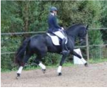
Ikke v h Hunzedal foto links, Rechts Topspeed Fortuna